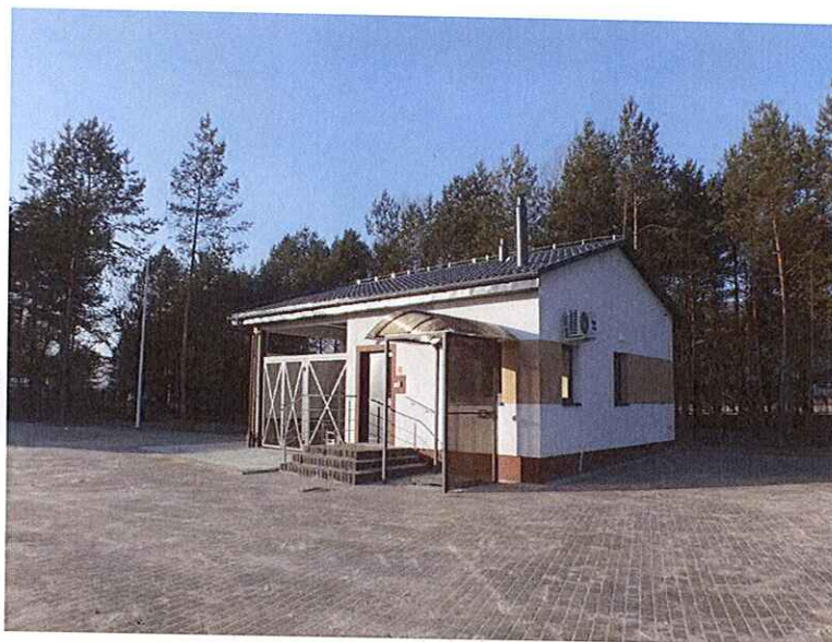
Rys. 2 Istniejący budynek PSZOK wraz z nawierzchnią z kostki brukowej